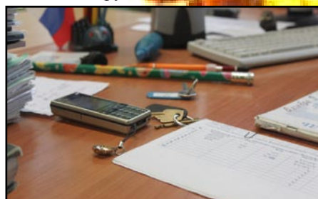
Стандартный набор учителя

Раньше в СССР День учителя отмечали в первое воскресенье октября, начиная с 1880 года. В 1994 году ЮНЕСКО учредил Всемирный день учителя, который с тех пор празднуется 5-го октября более чем в 100 странах мира. 5-го октября объявится победитель, один из 76 учителей, выигравших в своих регионах, приз – «Большой хрустальный пеликан».