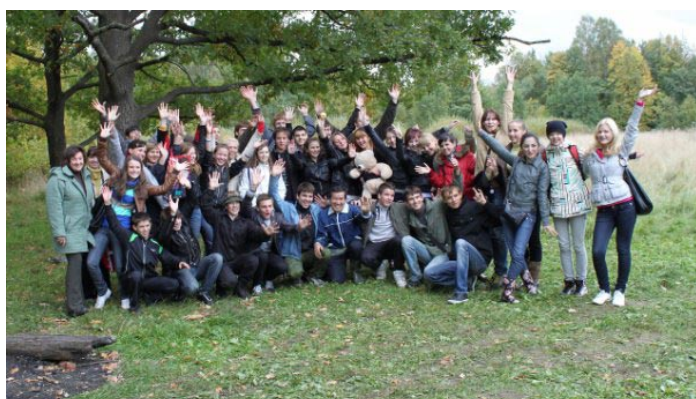
За этот турслет 10-е классы стали чуть ближе друг ко другу. Хотя бы на фотографии