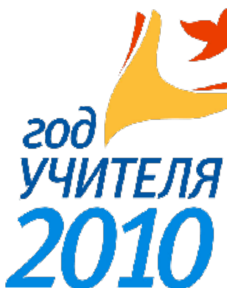
Эмблема года учителя