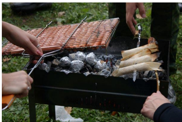
Куда же они все-таки делись после турслета?