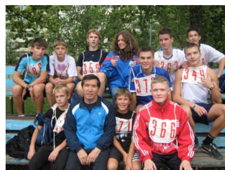
Молодцы и молодчина