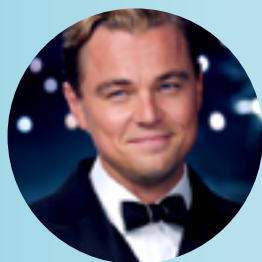
Леонардо Ди Каприо

Русский писатель, мыслитель, философ и публицист. Классик мировой литературы, по данным ЮНЕСКО, один из самых читаемых писателей в мире. Федор Достоевский с детства мечтал стать писателем. Первый же его роман «Бедные люди» был высоко оценен, а четыре поздних произведения вошли в список «100 лучших книг всех времён».