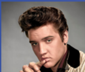
ЭЛВИС ПРЕСЛИ 08.01.1935

В первый месяц 2022 года в нашей рубрике «именинников» мы хотим рассказать о людях, которые умеют виртуозно владеть словом в разных стилях и проявлениях. Здесь вы встретите поэтов и музыкантов различных эпох. Также мы не могли не упомянуть об одном из самых известных учёных. Он, может, и не писал стихи, но современное поколение знает о нём, как раз благодаря упоминаниям в литературных, музыкальных и кинематографических произведениях.