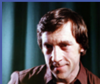
Владимир Высоцкий 25.01.1938

У Стивена была редкая медленно развивающаяся форма болезни моторных нейронов, которая постепенно на протяжении десятилетий парализовала его. После потери речи Хокинг был в состоянии общаться только посредством синтезатора речи. Но это не помешало ему развиваться в науке и заниматься любимым делом.